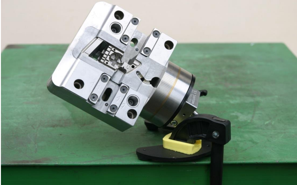
Ukázka uchycení tvarové vložky na polohovacím magnetu o průměru 100mm. Hmotnost vložky 8,3kg, rozměry – 140x160x60mm