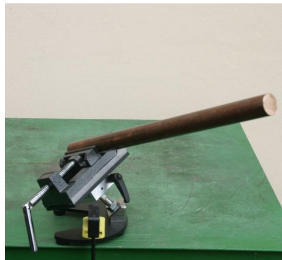
Ampcoloy \varnothing 30x450mm, Hmotnost 3,3kg