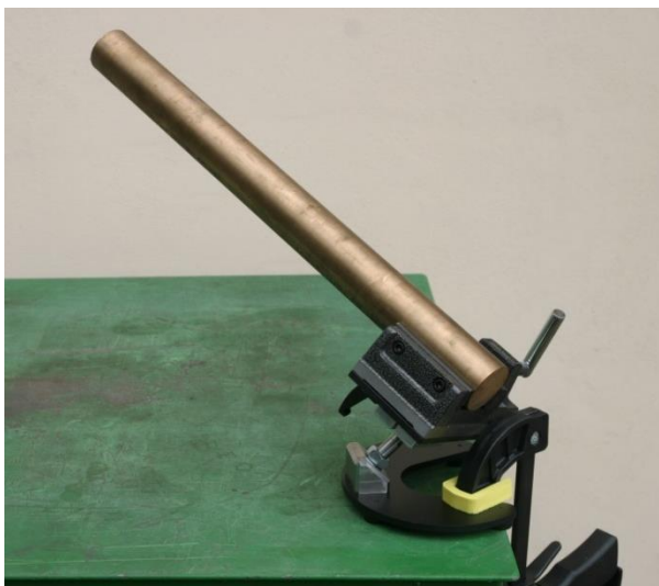
Ampcoloy \varnothing 44x500mm, Hmotnost 6,2kg